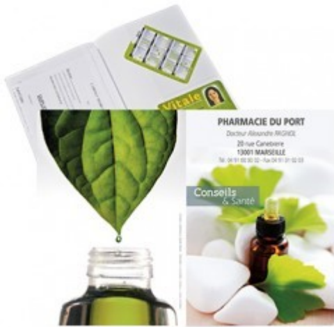
Porte ordonnance et carte vitale aux motifs végétaux