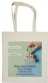
Le sac coton orienté écoute accueil conseil