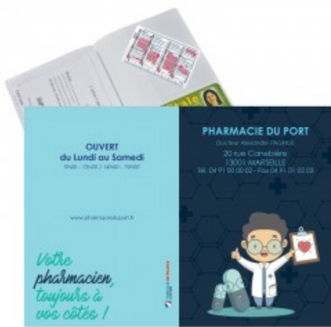
Porte ordonnance et carte vitale « à vos côtés »