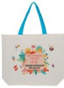
Le tote bag coton aux couleurs de l'été