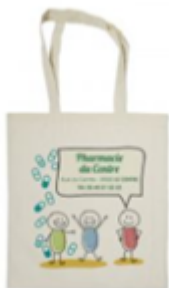
Le sac de rentrée à offrir aux parents