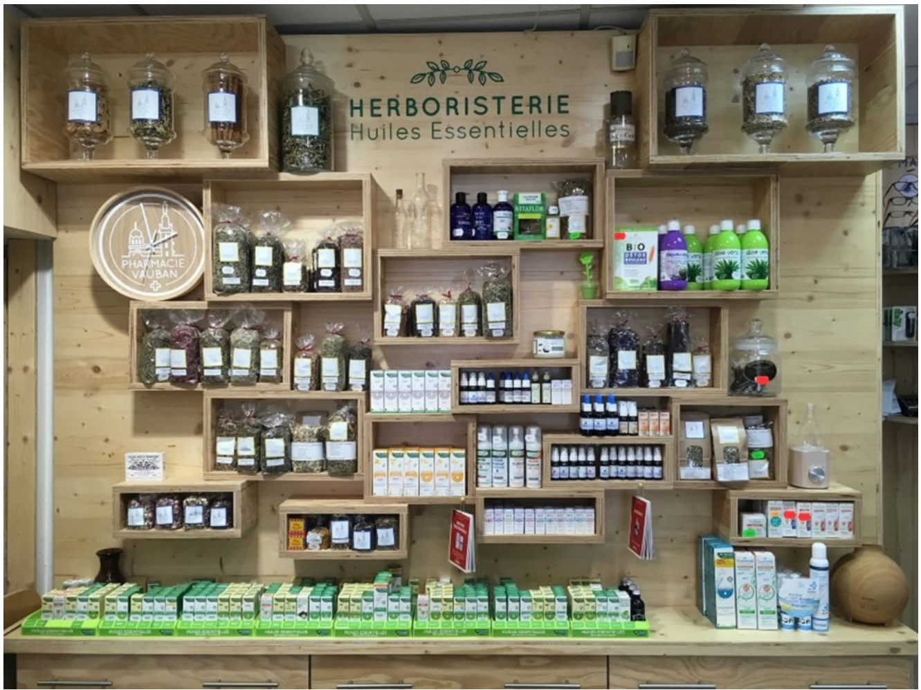
Pharmacie et herboristerie Vauban à Marseille