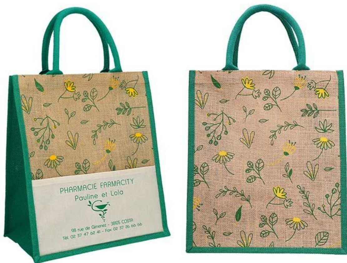
Sac pharmacie en toile de jute et coton naturel