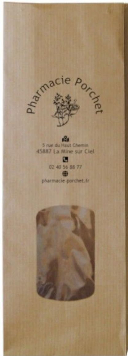
Sachet herboristerie en kraft brun